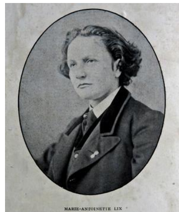
Document remis par Gérard ANDLAUER aux DNA (Article du 31 mai 2009 pour le 170 e anniversaire de naissance)

Ces lignes n'ont d'autre prétention que de la présenter, de souligner son originalité, de jalonner son itinéraire, pour inviter à faire plus ample connaissance avec une destinée qui n'aurait été que romanesque si elle ne s'était pas inscrite dans l'Histoire de nos régions et de l'Europe.