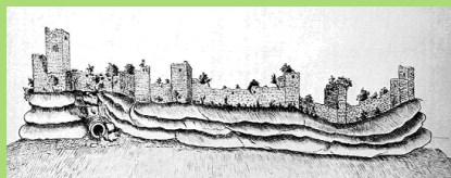
Château de Pierre Percée vers 1755

L'évêque choisit cet avoué parmi ses proches parents, dans la famille d'un noble guerrier élu anti-roi de Germanie, Hermann 1 er comte de Salm , du nom d'une rivière et d'une petite ville des Ardennes belges. En 1111, c'est Hermann II qui est voué de l'abbaye de Senones, ou héritier de son père et confirmé à cette place ou premier nommé... En épousant Agnès de Langenstein (Longue Pierre puis Pierre Percée), fille du comte de Bar et nièce d'un futur pape, Hermann s'apparente à une grande famille lorraine. Il s'opposera pourtant à son beau-frère, Etienne de Bar, bientôt son suzerain en qualité de 53 e évêque de Metz ! Hermann séjourne dans le château de Pierre Percée, considéré depuis comme le berceau des Salm et installe pour des siècles le destin des Salm dans la région. La vouerie est en effet héréditaire !