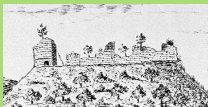
Château de Salm vers 1755