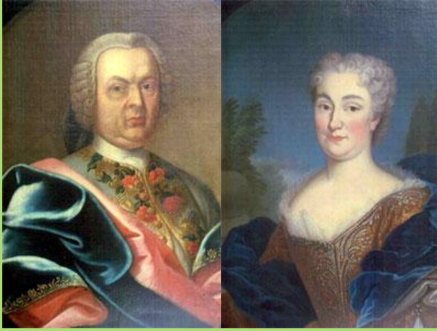
Nicolas-Léopold et Dorothée de Salm

revient à François de Vaudémont garde l'appellation comté de Salm et passe sous administration lorraine ; l'autre constitue la Principauté de Salm qui comptera cinq princes d'Empire germanique pendant son siècle d'existence.