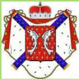
Armes de Jean VI de Salm