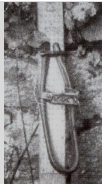
Deux modèles de fixations

accessible depuis Colmar ; Gérardmer centre de sports d'hiver réputé pour le patin, la luge et le ski ; la Schlucht-le Hohneck desservi par tramways depuis Munster et Gérardmer ; le Champ du Feu, le plus proche de Strasbourg ; le Petit Ballon et d'autres accessibles par le train ou possédant des fermes délaissées louées par les associations pour l'hiver.