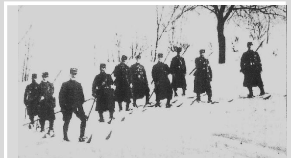
Une patrouille du 152 e RI Photographiée en 1906 près de Gérardmer

Les sites sont choisis selon la nature du terrain.